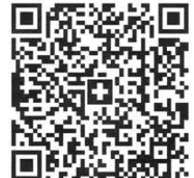
Kto SGKB Flawil

*Vorauszahlung der Miete innert 10 Tagen nach Vertragsunterzeichnung an St. Galler Kantonalbank Flawil IBAN CH92 0078 1205 5011 5400 9.