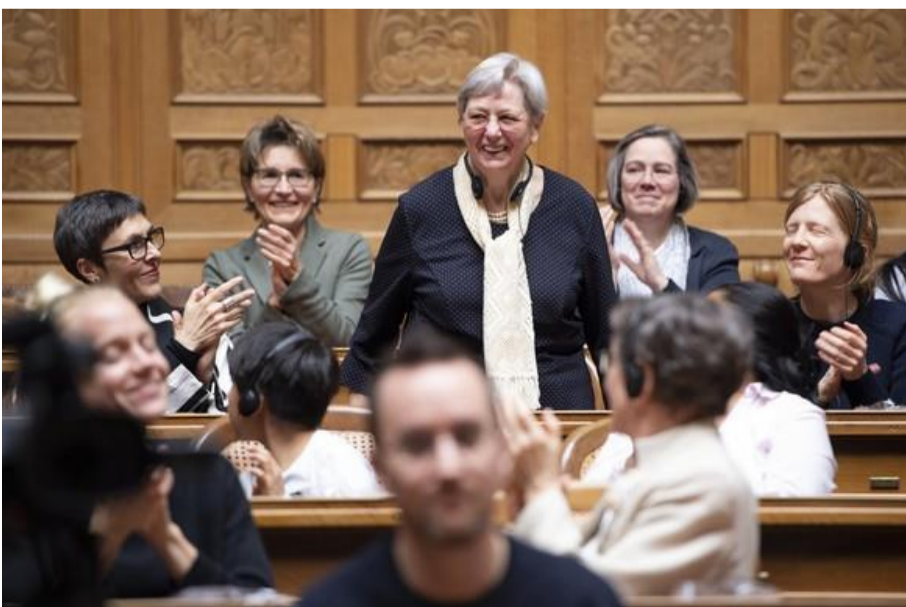
Alt-Nationalrätin Hanna Sahlfeld-Singer bei einer Podiumsdiskussion im März 2019 im Nationalrat.

Fast ist die Reise in die Vergangenheit vorbei. Sie geht nicht ganz spurlos an Hanna Sahlfeld-Singer vorbei. «Vieles kommt hoch», sagt sie. Sie erinnert sich daran, wie schnell Mütter als «Rabenmütter» verschrien waren. Sie erinnert sich, wie sehr die Gesetze Frauen benachteiligten; wie sie auch als Nationalrätin keinen teuren Teppich ohne die Unterschrift ihres Mannes kaufen konnte. Wie ihre Kinder nicht Schweizer Staatsbürger sein durften, weil sie mit einem Ausländer verheiratet war. Solche Hürden sind abgebaut. Und auch wenn noch nicht alles perfekt ist: «Die wichtigsten Gesetze sind geändert», sagt Sahlfeld-Singer mit einer gewissen Erleichterung.